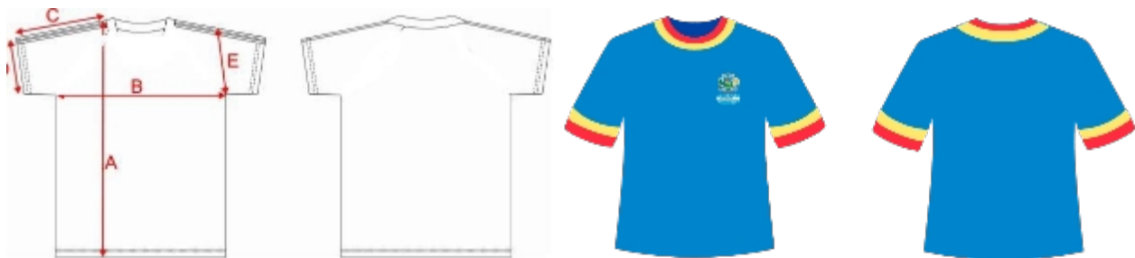
TABELAS DE MEDIDAS (PEÇA ACABADA)